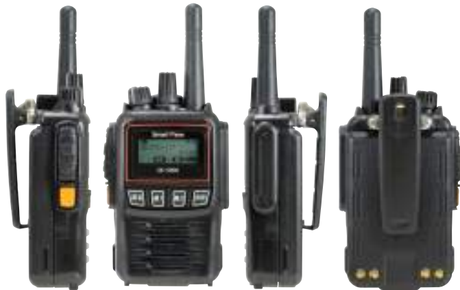
ドコモビジネスランシーバ認定品